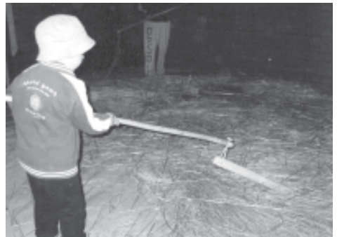
Pienetkin saivat kokeilla varstomista Westerkullan kartanon riihessä