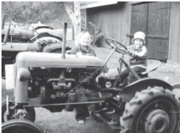
Ylpeä "traktori- kuski"