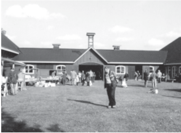
Westerkullan kartanon navetan sisäpiha